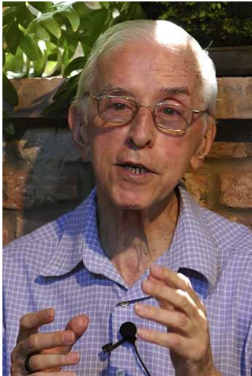
Dom Pedro Casaldáliga