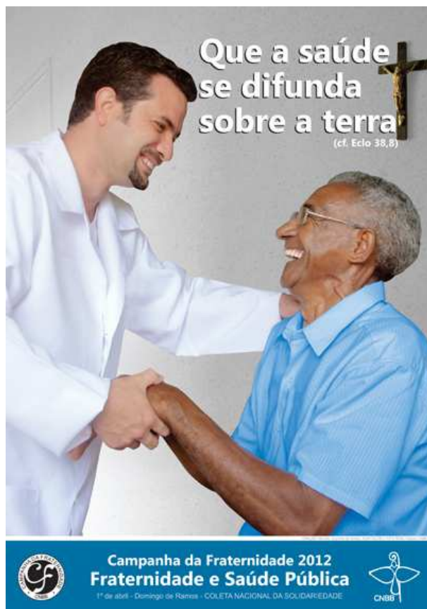
Affiche de la campagne de fraternité 2012